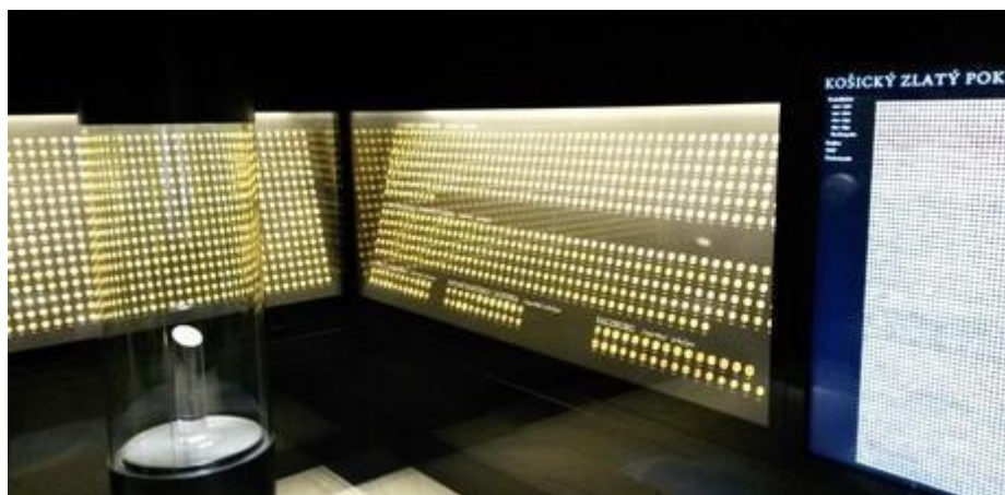
Obrázok Inšpirácia technického riešenia Košický zlatý poklad